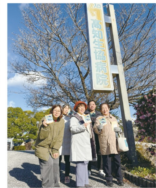
高知生協病院に到着した参加者たち

前回に引き続き、公共交通座談会をお届けします。後編は、現状からこれからの交通網の展望を考えます。