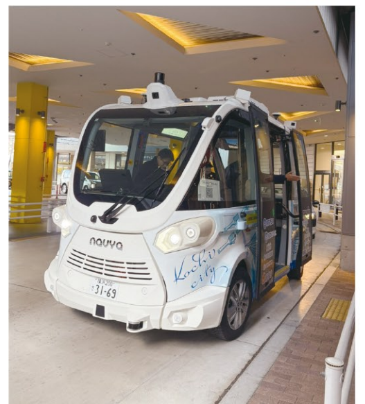
期間限定でイオン～高知駅間を走行した自動運転バス

府川…高知駅からイオンの間は人が沢山歩いていますよね。高知県内であれだけ人が歩き