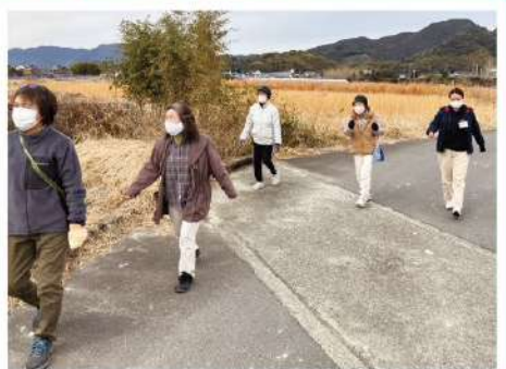
(文・高知生協病院 リハビリテーション科 花岡里菜)

かしまし班とレモンガラス班の合同で、1km程度のウォーキングに私も出かけました。日々の運動習慣により歩行速度に差は出ましたが、和気あいあいと楽しく行えました。今後も自身の姿勢に意識を向けつつ、まずは短距離から無理なく継続していけたらいいと思います。