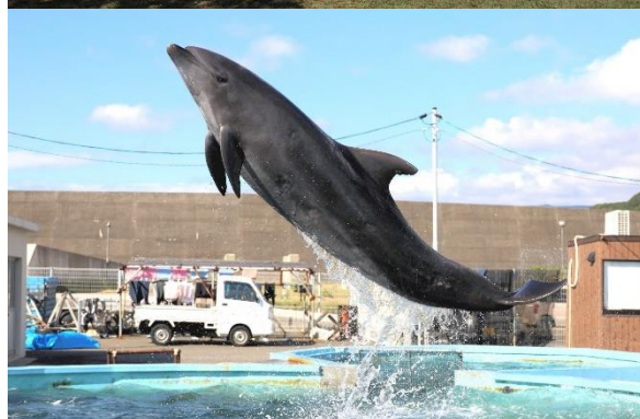
巨大な体の見事なジャンプに拍手喝采