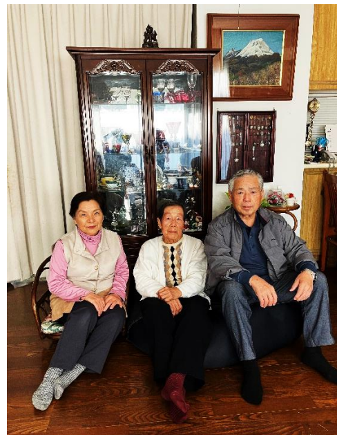
4人の班ですが、もう1人のプリンセスは当日参加できず3人でパシャリ

班結成の後は、地域訪問へ。そこで手配りさんを1名ゲットし、増資者件数の月間目標も達成☆