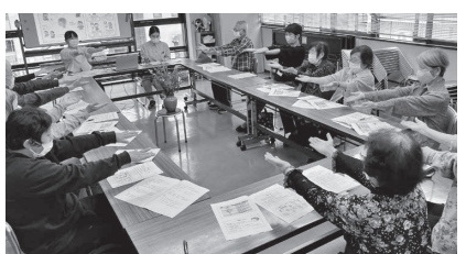
脳梗塞を発見する「FASTチェック」

資料はたくさん図が入っていて分かりやすく、ほとんどの人が質問をしましたが2人とも丁寧に答えてくれました。頭を使った後は、みんなでおいしく楽しくお弁当。来月は、高齢者の人権を守るお話です。