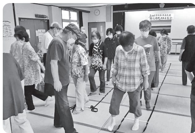
「思うように動かん」コグニラダー

「楽しく体験しよう コグニサイズ」を実施。いすに座り、数を数えながら足を上げる動作や、床に置いたはしご状の枠を、変化をつけて歩くという簡単な運動ですが、なかなかうまくいきません。講師も失敗をするなど出来そうで出来ない運動に、笑いが絶えない楽しい講習でした。当日は新しい組合員が2人増え、増資も3件ありました。