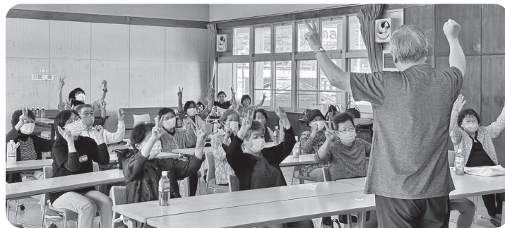
おはなし玉手箱の方と一緒に手遊び