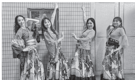
ベリーダンスのみなさん