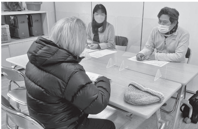
昨年度の相談会の様子

どこに相談すればよいか分からず、悩みをひとりで抱え込んでいませんか? どのようなことでも構いません。秘密は守られますので、安心してご相談ください。