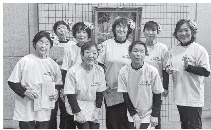
JA 婦人部コーラスひまわり

すさき診療所は、今年の10月1日で開院20周年を迎えました。10月14日の祝賀会には、すさきブロック内外の組合員や役員など約100名が参加し盛会となりました。