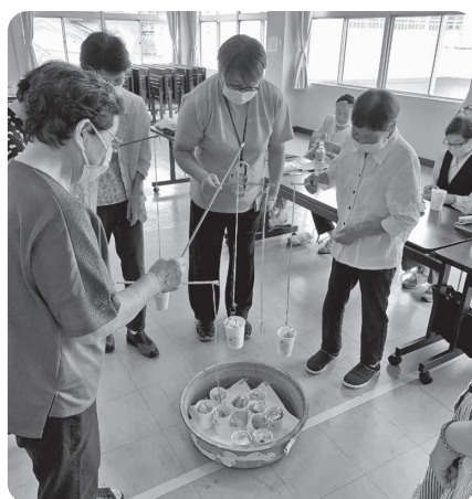
紙コップにはお菓子がいっぱい!

レクリエーションは、DVDを見ながらタオル体操。釣り堀大会は、昔使っていた金だらいにお菓子の入った紙コップを並べて釣り上げるといった遊び、最後はジャンケン選手権。勝ち残った方に景品を進呈しました。