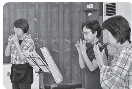
オカリナサークル「オリーブ」の演奏

黒潮町保健福祉センターで行い、22名の参加がありました。オカリナサークルによる、『らんまん』の主題歌を含む計5曲の演奏と、地元で伝わるお話を大きな紙芝居にして広めるボランティア活動をされている『おはなし玉手箱』の方が公演してくれました。オカリナの音色に癒され、一緒に歌を歌い、紙芝居を真剣に見ていた組合員さんたちも、月間に向けて元気になれた集会となりました。