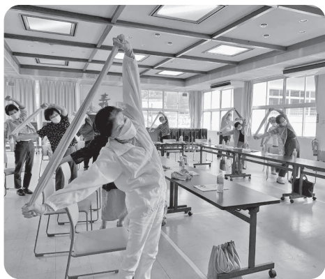
うーん、とストレッチ

コロナが5類になって、初めての生協強化月間(以下、月間)です。食事会やレクリエーションも再開され、感染対策をしながらも徐々に楽しい企画ができるようになってきました。今年の月間は「地域に出る」活動がテーマです。そのきっかけである各支部のスタート集会の様子をご紹介します。