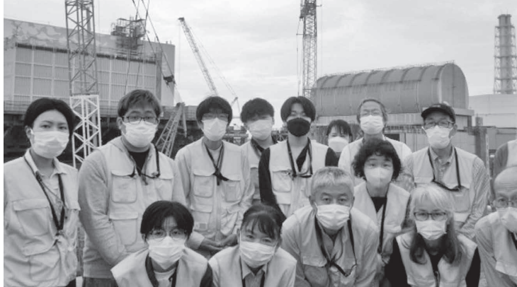
福島第一原発1・2号機前にて。見学に防護服はいらすマスクのみ。

国道114号線沿いは所々除染作業が行われ、特定復興再生拠点区域では「居住区域のみを除染するから戻りなさい」と言われているようですが、山菜や筍掘りをしていた里山は除染されることがないため、自宅だけ除染されても戻す気にはなれないという声もあるそうです。