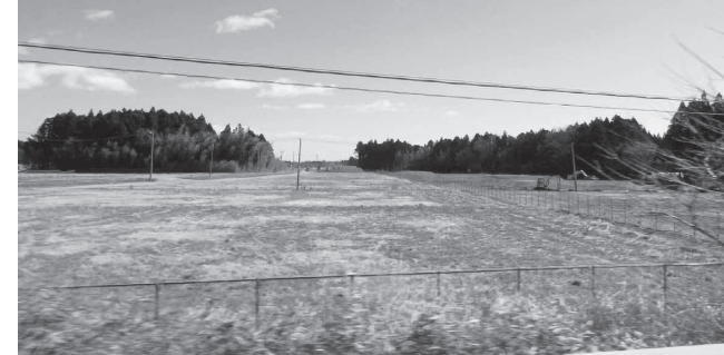
フレコンバッグが置かれていた場所 (富岡町中間貯蔵仮置き場)

富岡町から大熊町を通り、双葉町の福島第一原子力発電所へ向かいました。帰還困難区域に入ったとたん、廃墟となった店舗や住宅、荒れた田畑、狼の群れが見えました。廃墟になった「しまむら」には当時のままの衣料品がありました。田畑は雑草を通り越して雑木林になっています。汚染土が入った黒いフレコンバッグは、東京オリンピックの聖火リレーが通るため中間貯蔵施設へ移動していました。