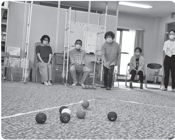
潮江支部コスモス班のボッチャ

コロナ禍での自粛生活は、心と体両面でのダメージを多くの方に残しました。今年のスローガンは、「地域に出る」活動で、自分の地域との新たな出会いを楽しもうと大きく「ジャンプ」のための知力・体力づくりです。