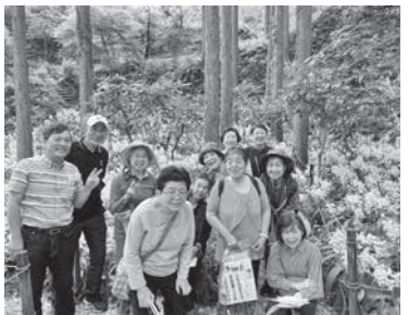
みごとな岩石蘭に囲まれて (牧野公園にて)

11名で佐川町へ。植物を描いたピカピカマンホールの蓋や、風情ある酒蔵の風景。蘭林塾や名教館、牧野富太郎ふるさと館、金峰神社では多くのバイカオウレンの葉が見られました。牧野公園では見事な岩石蘭の黄色い群生。日常を離れて仲間と共に過ごすことの大切さを感じ、そして楽しかった思い出が明日への力になると実感した支部レクでした。