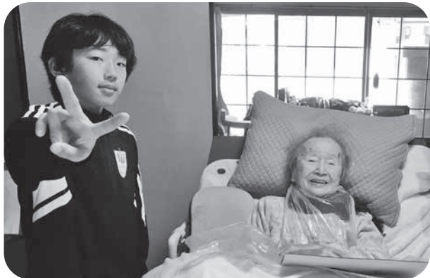
ひ孫に会えて笑顔のAさん

乳がんと膀胱がんで入院していたAさんは、入院中に新型コロナにかかってしまいました。新型コロナにかかるとリハビリができなくなるので、AさんのADL(注)はほとんど落ちていきましました。がんの進行により食