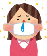
花粉症、アレルギー 性鼻炎、アレル ギー性結膜炎