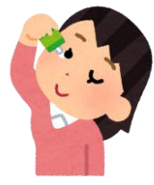
白内障、緑 内障、ドラ イアイ