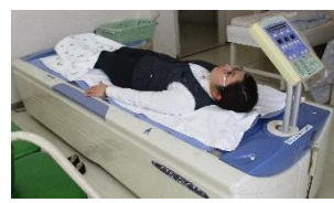
ウォーターベッド