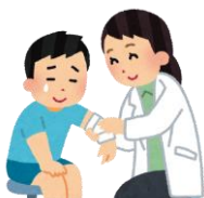
切り傷、擦り傷、 ムカデ咬傷、虫刺 され