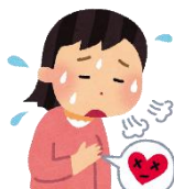
高血圧、動 悸、息切れ