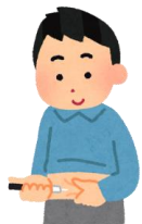
糖尿病、イン スリン療法